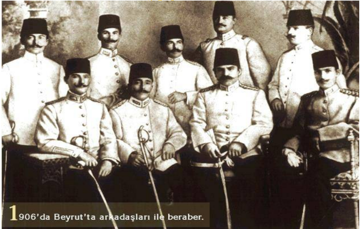
1906'da Beyrut'ta arkadaşları ile beraber.