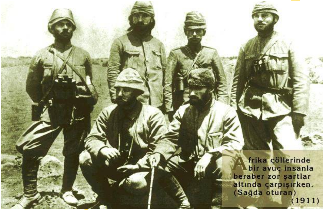
Afrika çöllerinde bir avuç insanla beraber zor şartlar altında çarpışırken. (Sağda oturan) (1911)

Mustafa Kemal, Trablusgarp'ta bulunduğu sırada binbaşılığa terfi etti.