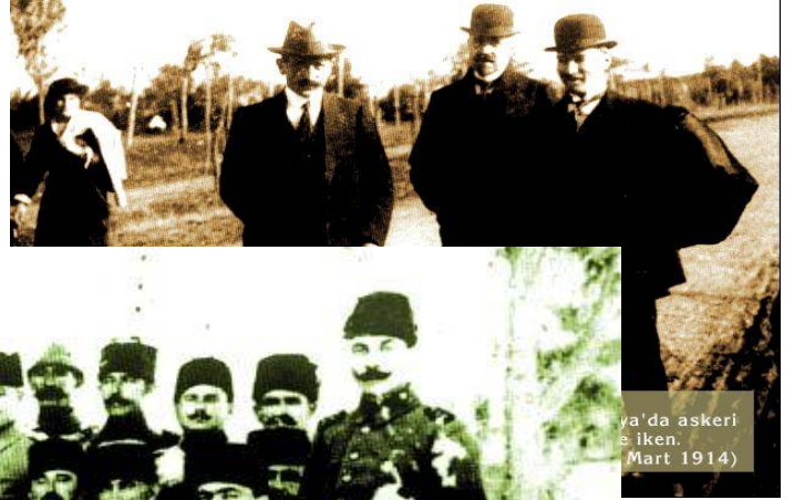
ya'da askeri e İken. (Mart 1914)