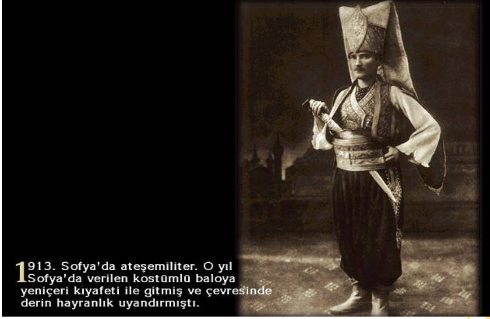
1 913. Sofya'da ateşemiliter. O yıl Sofya'da verilen kostümlü baloya yeniçeri kıyafeti ile gitmiş ve çevresinde derin hayranlık uyandırmıştı.