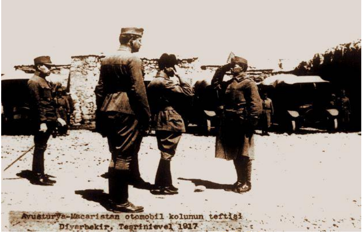
Avusturya-Macaristan otomobil kolunun teftisi Diyarbakir, Tesrinievel 1917