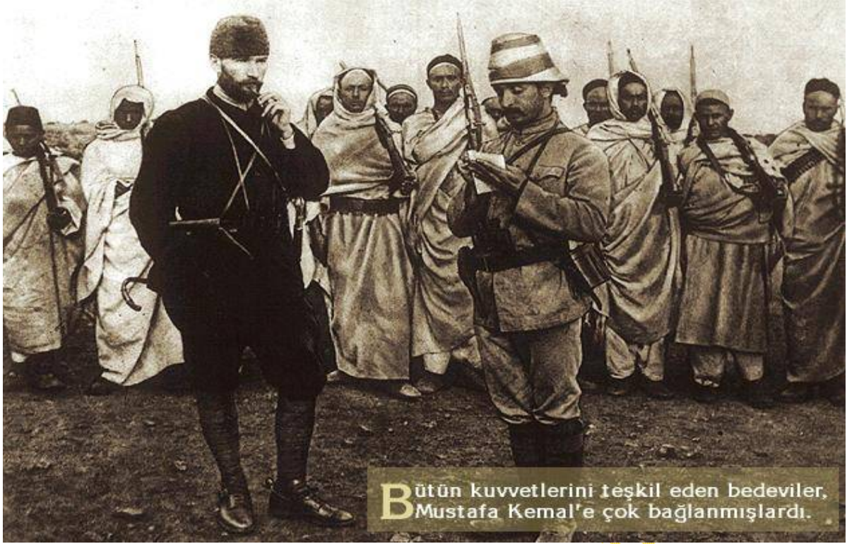
B ütün kuvvetlerini teşkil eden bedeviler, Mustafa Kemal'e çok bağlanmışlardı.